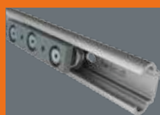
Torsionssteife Rollenführung Roulement linéaire à rouleaux rigides à torsion