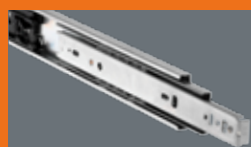
Teleskopschienen Rails télescopiques

Stark in jedem Fall! Fort en toutes circonstances!