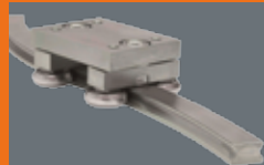
Radius- / Kurvenführungen Rails avec rayon