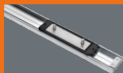
Linearführungen Guidages linéaires